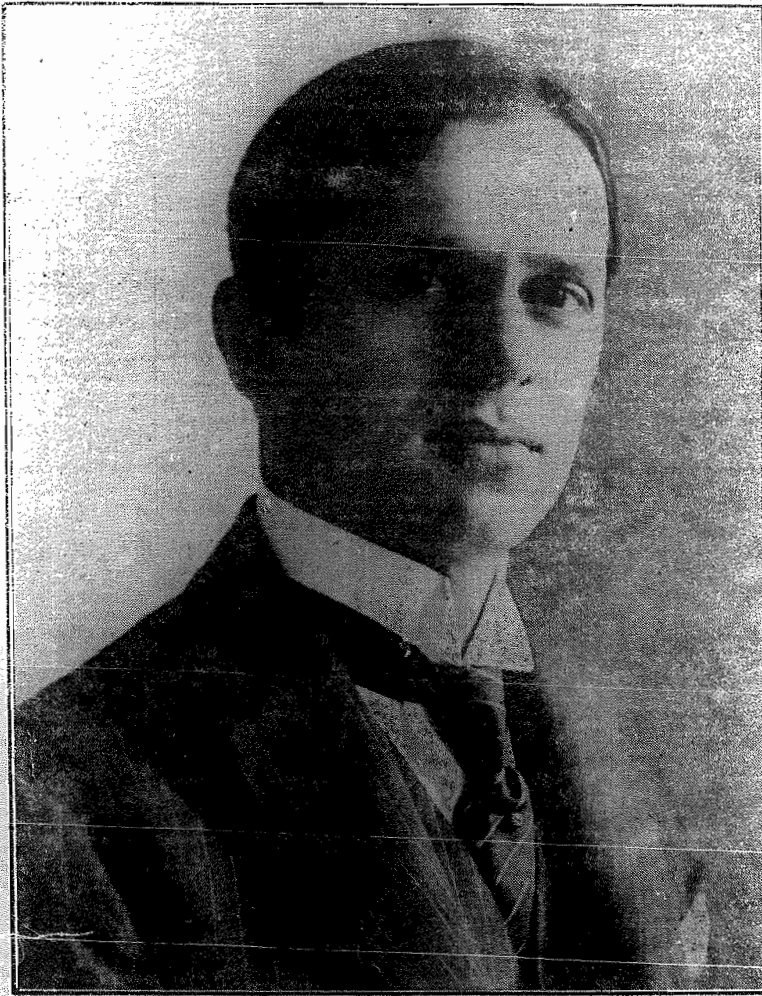
Presidente Adolpho Konder

A recente viagem, aliás iniciada silenciosamente, discretamente, assigna nas suas grandes linhas, um periodo digno de ser destacado entre os mais laboricosos do quadriennio Adolpho Konder. Deve ter a sua historia á parte, tal o vulto dos problemas tratados e resolvidos durante ella. Enumerá-los seria fornecer elementos