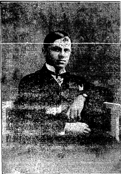
Presidente Adolpho Konder

«Representando o povo riograndense a pessoa do sr. Presidente, que é a afirmação triumphal da intelligencia invulgar e o padrao de orgulho da moderna geração de politicos brasileiros, eu, apresentando-lhe as homenagens do povo e do governo de Santa Catharina, bebo pela saude pessoal de vossa excellencia, pelo esplendor do Rio Grande do Sul, pela gloria do Brasil».