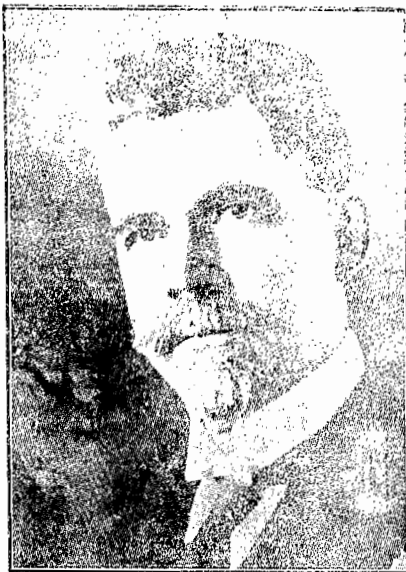
Presidente Washington Luis

O dr. Adolpho Konder respondeu agradecendo em brillante e curta oração, dizendo: