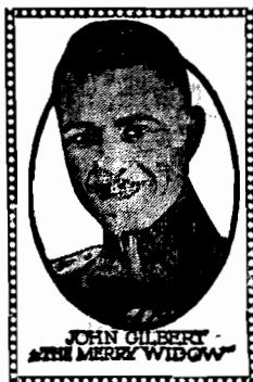
JOHN GILBERT AND MAE MURRAY THE MERRY WIDOW

Uma maxina da UFA de Berlim em 11 duplas partes.