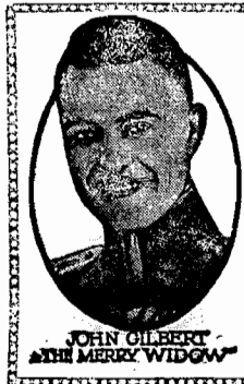
JOHN GILBERT THE MERRY WIDOW