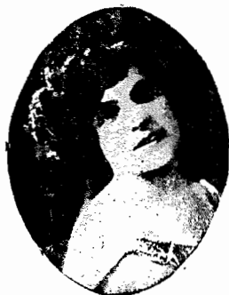
TINA MAGNOLI - Soprano

Hoje 3a. feira, 5 de Fevereiro de 1929 Hoje