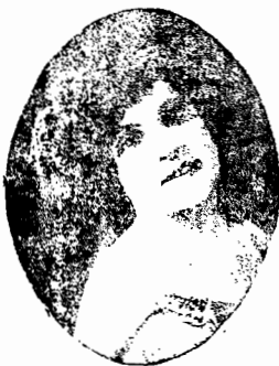
TINA MAGNOLI - Soprano

Hoje Domingo, 3 de Fevereiro de 1929 Hoje