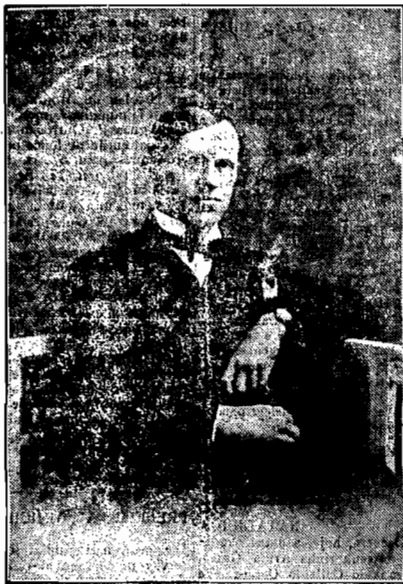
Presidente Adolpho Konder

Realizou-se, hontem, ás 14 horas, na sala de Despachos do Palacio, o acto de transmissao do poder ao sr. vice-presidente do Estado Walmor Ribeiro. A cerimonia teve grande assistencia, notando-se a presenca das altas autoridades civis e militares, chefes e funcionarios das