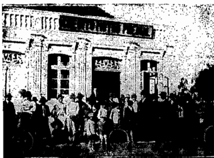
Sede da Filial do 'CREDITO' em Joinville

MUITOS PREMIO MENORES ! MUITAS ISENÇÕES !