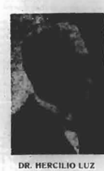
DR. HERCILIO LUZ

Faz, hoje, dois annos que foi inaugurada a ponte metálica, ligando a ilha ao continente. Obra maravilhosa de engenharia que surprehe pelo arrojado de sua concepção, a ponte Hercilio Luz n.ºtabiliza a acção creadora do seu ousado patrono. Aspiração maxima da gente catharinense que através de todos os tempos se batia pela sua realização, ella concretizã brilhantemente a vontade de um povo. Hercilio Luz, o saudoso estadista que foi um dos maiores realizados dos mais notáveis melhora, entos materias da sua terra, não mediu esforços para a execução dessa obra formidável, sem igual na America do Sul. Factor incontestado do engrandecimento de Santa Catharina,