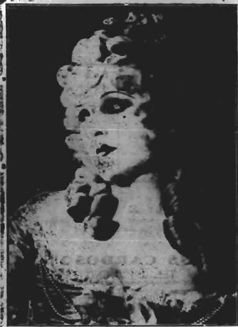
Lya de Putti -EM-