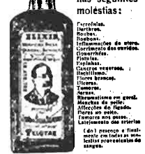
GRANDE DEPURATIVO DO SANGUE

Empregado com successo nas seguintes moléstias: