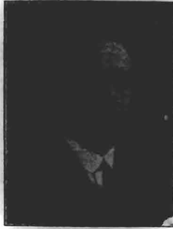
Ministro das Relações Exteriores