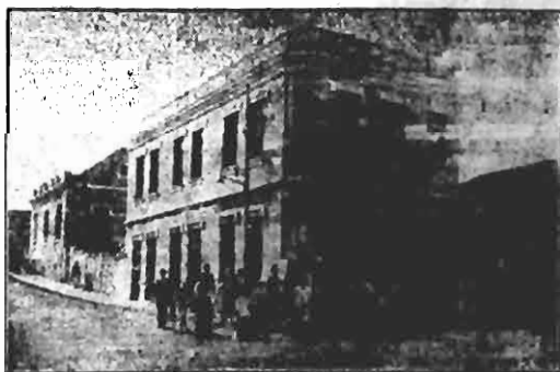
SEDE DA FILIAL DO "CREDITO" EM FLORIANOPOLIS