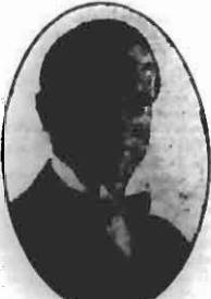
Governador do Estado