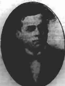
Ministro de Viação

No salão da honra do Distrito Telegraphico desta capital, realizouse ante-hontem, ás 14 horas, a inauguração dos retratos dos srs. governador Adolpho Konder e ministro da Viação Victor Konder.