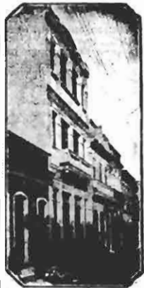
Estação e Chefia do Distrito Telegraphico