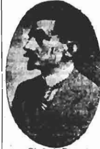
Chefe do Distrito