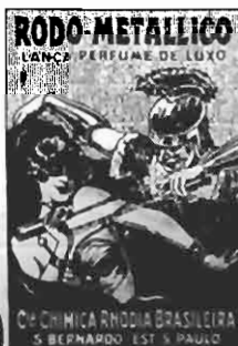
RODO-METALICO LANÇA PERFUME DE LUXO C.A. QUIMICA RHODIA BRASILEIRA S. BERNARDO - EST. S. PAULO

Communico aos senhores negociantes desta capital e do Interior que acabo de firmar contracto com a Cia. Chimica Rhodia Brasileira de São Bernardo (Est. São Paulo) Fabricante dos afamados Lança-Perfumes Rodo e Rigoletto, para a venda exclusiva desse artigo carnavalesco nesse municipio e circunvinhança. Essas duas marcas de Lança-Perfumes obedecem como sempre 30, 60 e 100 grammas.