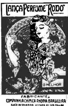
FABRICANTES COMPANHIA QUIMICA RHODIA BRASILEIRA SÃO BERNARDO (ESTADO DE SÃO PAULO)