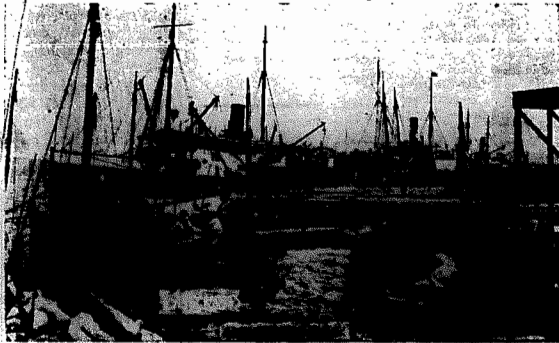
Laguna. Trecho do porto