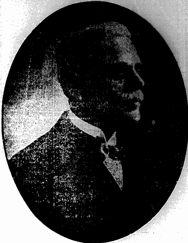
Dr. Hercilio Luz, governador do Estado

A Ponte Independencia, cuja grandeza assistiu os tímidos de toda a especie, e os scepticos atrevidos ao pro-