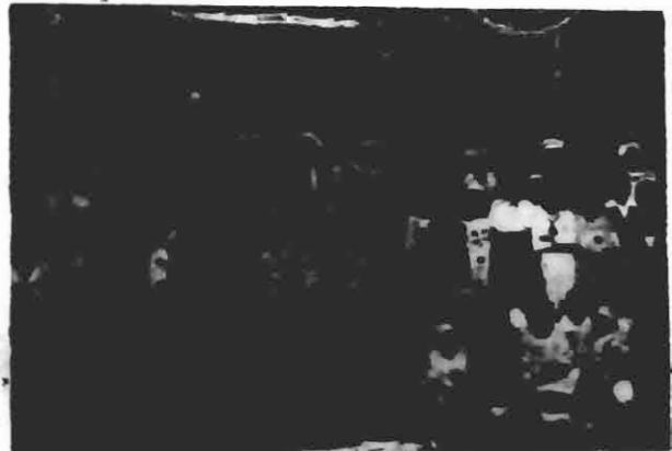
Aspecto do baile infantil realizado no salão do sympathico "CLUB CONCORDIA"