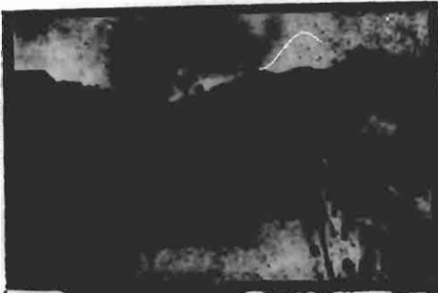
Trecho inicial, já pronto, sendo-se reconstruída a antiga e histórica PONTE DO VINAGRE