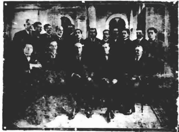
Grupo de deputados posando para a REPÚBLICA