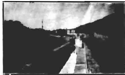
PERSPECTIVA DO CANAL DA AVENIDA DO SANEAMENTO ENTRE JOSÉ JACQUES E AVENIDA DA PAZ