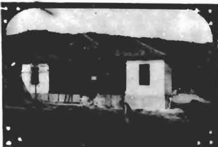
O stand em construção e a caserna