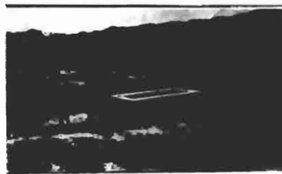
AS VACCAS GERSEY DO POSTO, EM SUAS PASTAGENS. POSANDO PARA A REPUBLICA