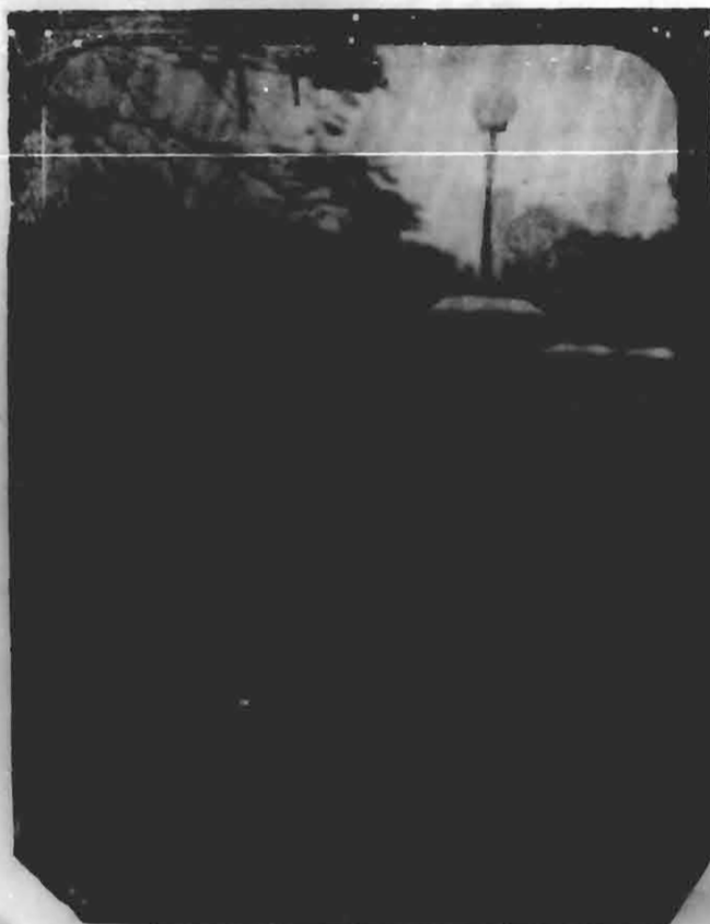
Seu mais recente retrato