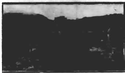
PEPLUM, MOSQUITO, FLORETE E OUTRO. REPRODUCTORES DO POSTO