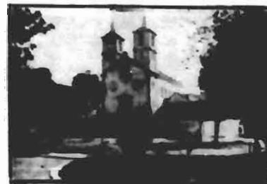
Trecho da Praça 15 de Novembro, onde se vê a Cathedral, que vai ser substituída por outra mais sumptuosa