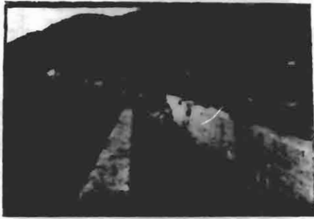
TRECHO DO CANAL DA AVENIDA DO SANEAMENTO, COMPREHENDENDO A AVENIDA DA PAZ E OUTRAS RUAS