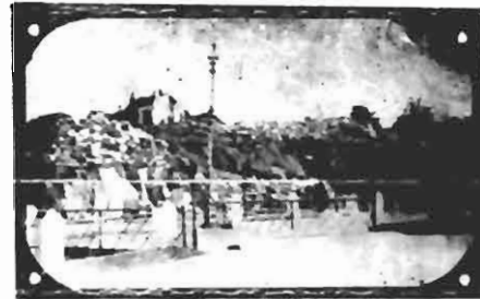
No local onde se vêm moles de pedras está sendo construída a nova Escola Normal