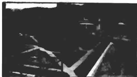
O PARQUE, A GARAGE, AS COCHEIRAS E AS SUAS CULTURAS