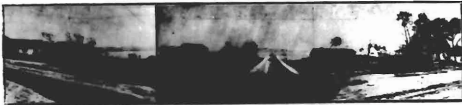
Neste local acha-se em construção a praça Dias Velho, onde haverá um bello jardim; o Sr. Dr. Hercílio Luz realiza allí grandes obras de saneamento