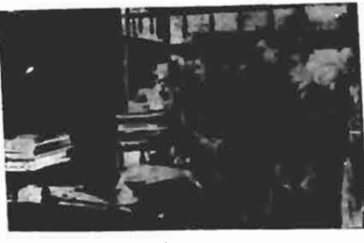
Acto da assignatura do contracto da Ponte sobre o Estreito, firmado hoje, no thesouro do Estado, e tre o Governo e o representante da firma Byington & Sundstrom.