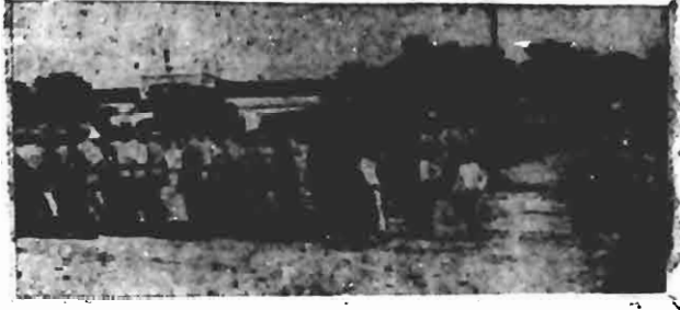
Desfile dos recrutas do 14º batalhão de Caçadores