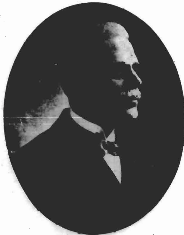
Eminente Governador do Estado

terland» que das cristas da Serra Geral se ondeia, entre rios e cordilheiras, até os longinuos e preciosos sertões do Pepery-guaçu.