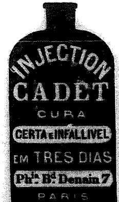
Depositor nas principais Pharmacias.