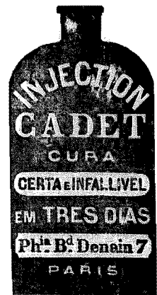
Depositos nas principaes Pharmacias.