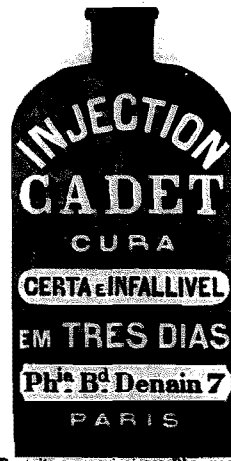
Deposito nas principaes Pharmacias.