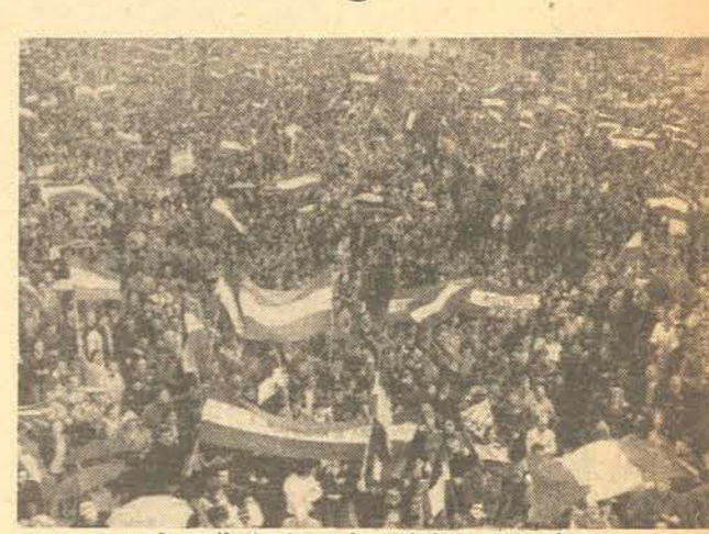
A manifestação em favor da independência.

Málaga, Espanha - A nova violência policial foi colocada ontem em Estado de Alerta total após uma explosão de violência que deixou um saldo de um morto, vários feridos e numerosos estabelecimentos saqueados, devido a manifestações em favor da autonomia.