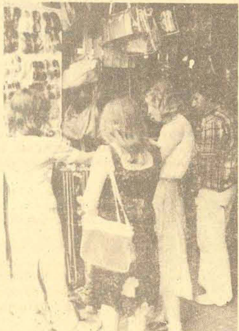
Comércio aguardando a recuperação dos negócios.

Para este mês, esperamos um crescimento no movimento de pelo menos 40 por