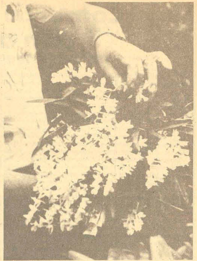
Além de Florianópolis, várias regiões do Estado — principalmente o Norte — são importantes nichos ecológicos de orquídeas. O valor da planta é atribuído à sua perfeita armação e o longo período que leva para florescer — entre 8 e 10 anos.

Se a intenção é conservar os raros espécimes de orquídeas remanescentes na flora nativa da ilha de Santa Catarina, outrora farta e variada, não há mais tempo a perder. Caso contrário, inexoravelmente, o acelerado desmatamento aliado à indiscriminada caça que é feita, acabará por exterminá-las, em seu habitat natural mais cedo do que se poderia imaginar.