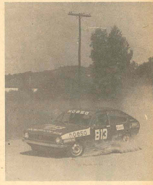
Passat da equipe Koesa, bem preparado e com chance.

A falta de patrocínio tem prejudicado muito as equipes catarinenses que, mesmo assim, estão agora melhor preparadas e esperam obter melhor resultado nesta etapa do Sul-Brasileiro.