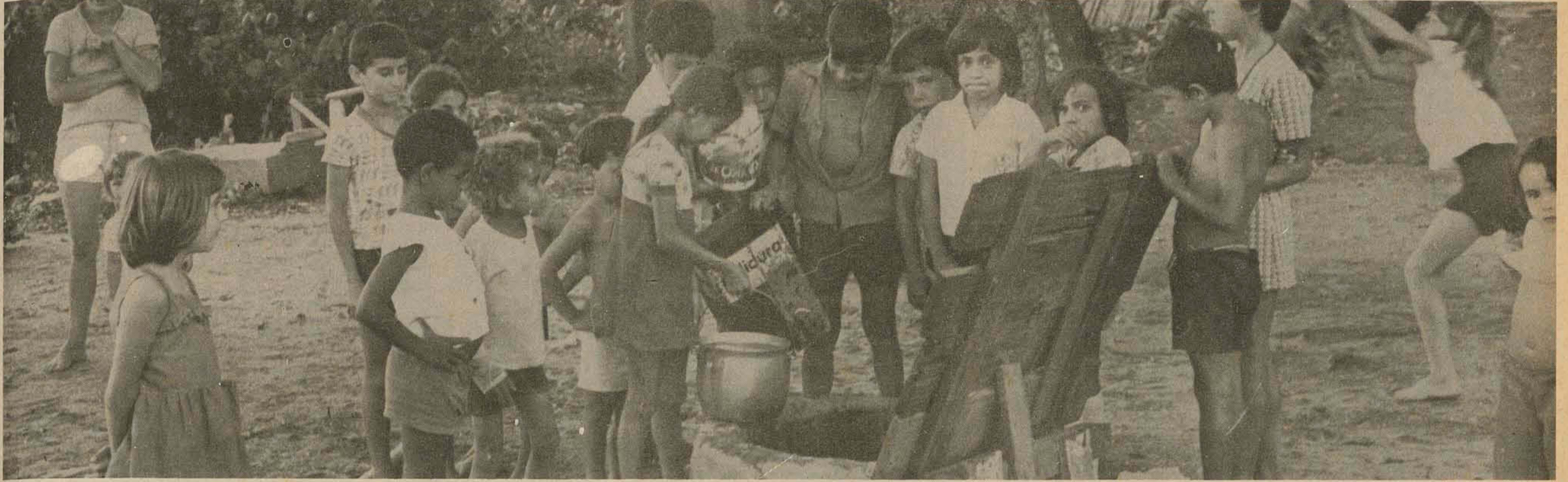
A falta d'água trouxe ontem sérios problemas ao florianopolitano, sendo grande a corrida aos poços artesanais existentes na Cidade. No Hospital Celso Ramos as visitas públicas estão suspensas.

Mais dois rompimentos na adutora dos Pilões, ocorridos ontem à noite, vão fazer com que a Cidade continue hoje sem água, pelo terceiro dia consecutivo. Alguns colégios pensam em suspender as aulas (Pág. 16)