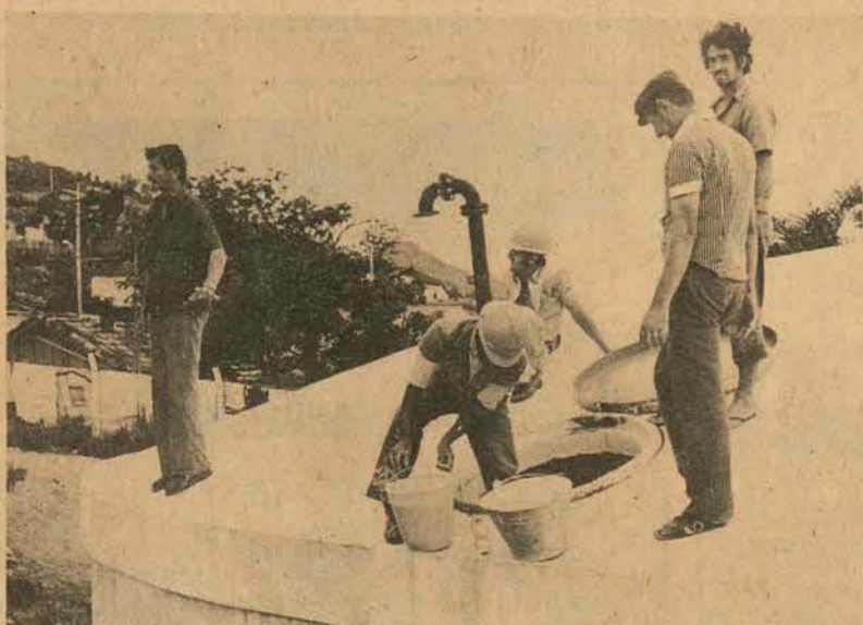
Os reservatórios da Casan serão sete em meados de 1976.

Até julho, 15 milhões de litros suprem a Cidade