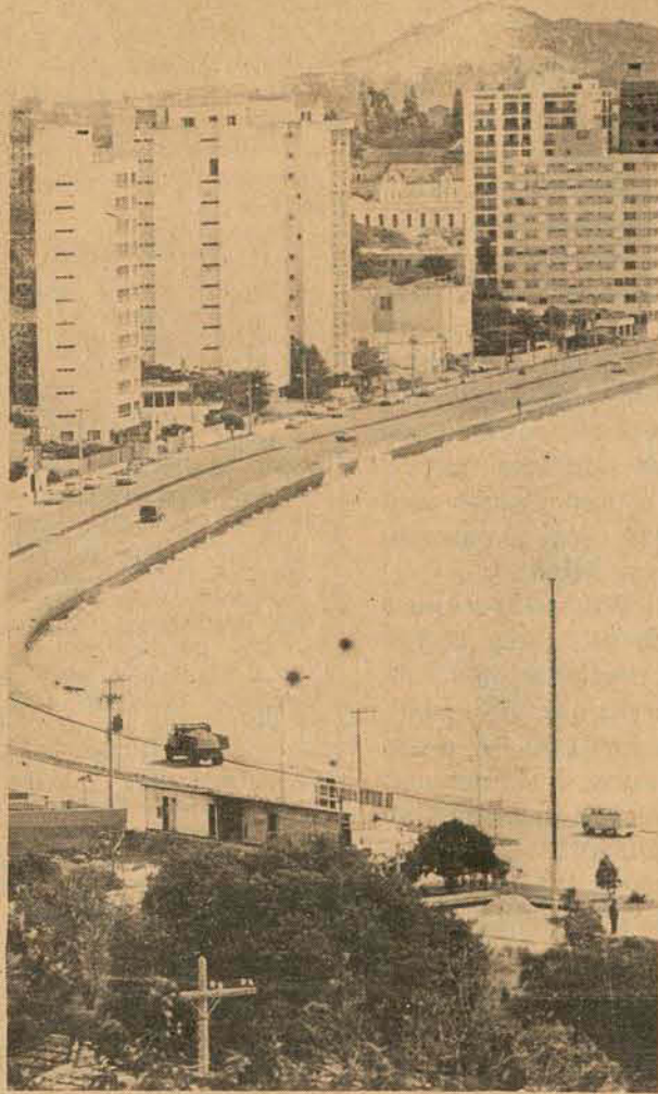
O prolongamento da Rubens Ramos tem projeto contratado.

E, finalmente, terraplenagem, obras de arte corrente, drenagem e serviços complementares na rodovia SC-465, no trecho Ipumirim-BR-283, no valor de 20 milhões e 500 mil cruzeiros, com prazo de conclusão de 360 dias. Terraplenagem, obra de arte corrente, drenagem e serviços complementares na rodovia SC-466, trecho Itá-Seára, num valor de 26 milhões de cruzeiros. Serão entregues também os avisos de licitação para complementação dos serviços de terraplenagem, drenagem e pavimentação asfáltica das estradas Brusque-Gaspar e Jaborá-BR-282.