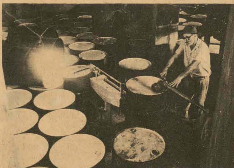
A extração e beneficiamento do óleo ainda é rudimentar.

Uma riqueza do Alto Vale estocada por falta de mercado