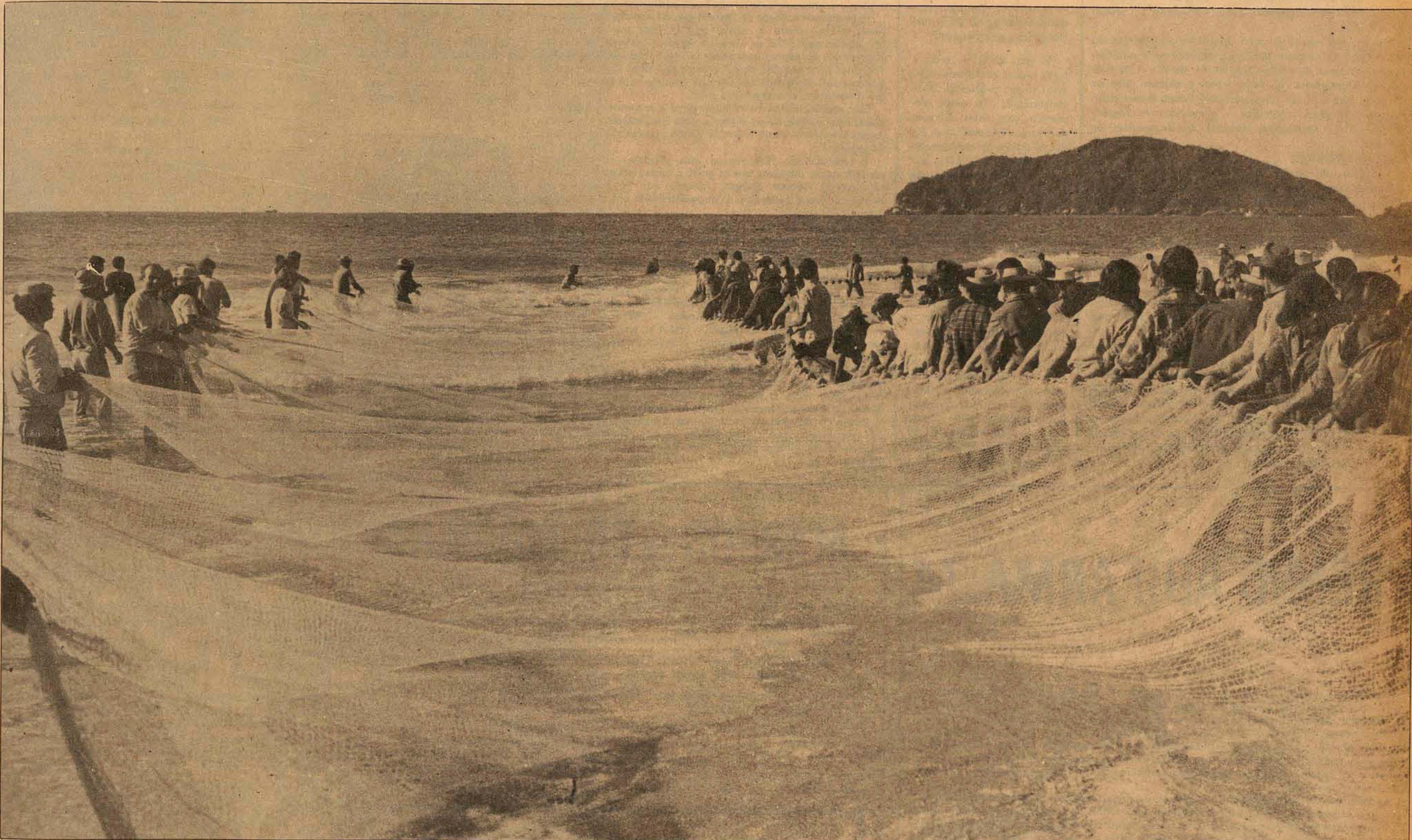
A dura faina de lançar o arrastão curte na adversidade os pescadores da Ilha. Com a invasão dos pesqueiros à área de 200 metros, os pescadores desejam ampliar a faixa legal para 1 milha marítima (P. 12).