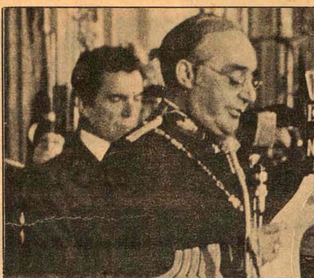
Spínola: o presidente jamais renunciará.

A alta inflação, aliás, faz parte da vida chilena, e desde que os militares tomaram o poder, derrubando o governo da Unidade Popular, ela ascendeu a astronômica cifra de 508,1 por cento, uma das mais altas taxas do mundo. E, finalmente, os cálculos otimistas prevêm para este ano — em que o escudo foi desvalorizado 10 vezes — uma inflação nada inferior a 250 ou 300 por cento.