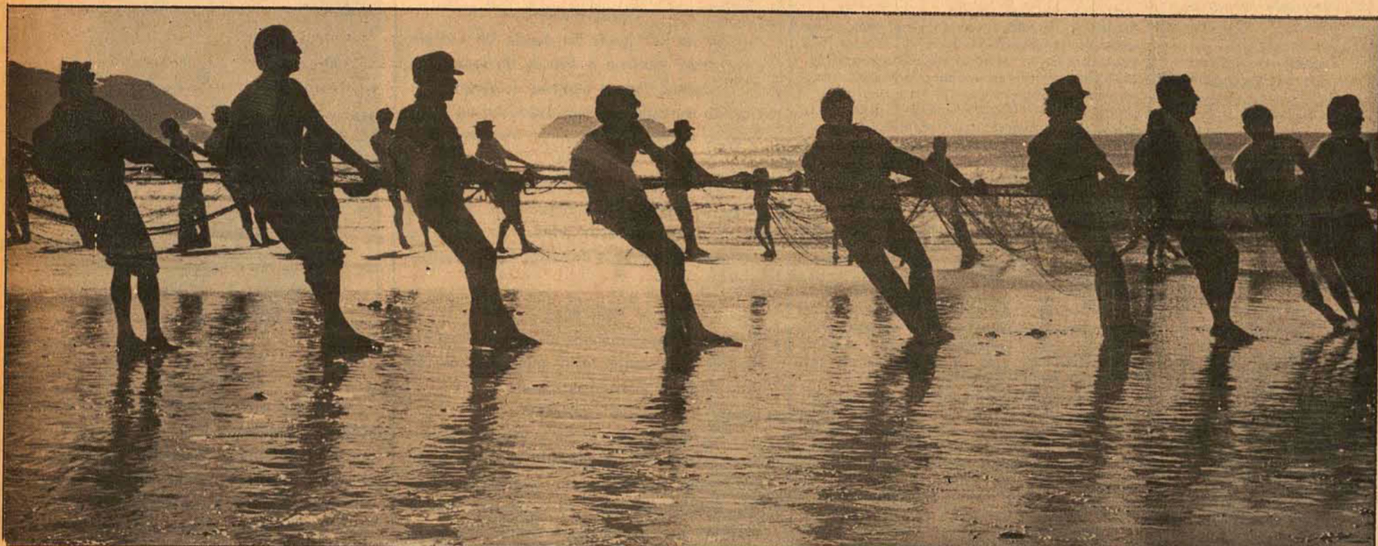
Os pescadores denunciam os barcos das indústrias pesqueiras, que invadem área destinada à pesca de arrastão.