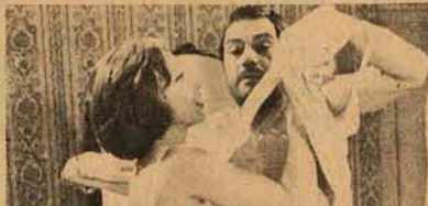
Antes que o Divórcio Chegue, de Vittorio de Sica.

ANTES QUE O DIVÓRCIO CHEGUE (Y. L. Llamaremos Andres) Comédia italiana, em linha satírica, em torno de um casal que não consegue ter um filho. As situações são criadas em torno do problema, com atuações de Nino Manfredi e Mariangela Melato. A direção é assinada por Vittorio de Sica, que depois, de uma fase decadente surpreendeu com O Jardim dos Finzi Contini. Eastmancolor. 18 anos. São José 3-7,45 e 9,45 horas.