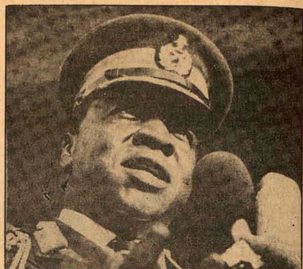
Idi Amin: "... mentirosos"

Para reavivar o processo, Peron e Stroessner — amigos de longa data —, deverão agora estabelecer as bases da complementação industrial. Esse objetivo será conseguido provavelmente com a criação de fundições de alumínio e fábricas de celulose com capital misto, mediante a construção da ponte Pesadas-Encarnacion; acelerando a construção de instalações hidrelétricas no rio Paraná; estabelecendo mais facilidades alfandegárias, e finalmente maior cooperação técnica e científica, tudo no âmbito dos acordos da Associação Latino-Americana de Livre Comércio — Alalac.