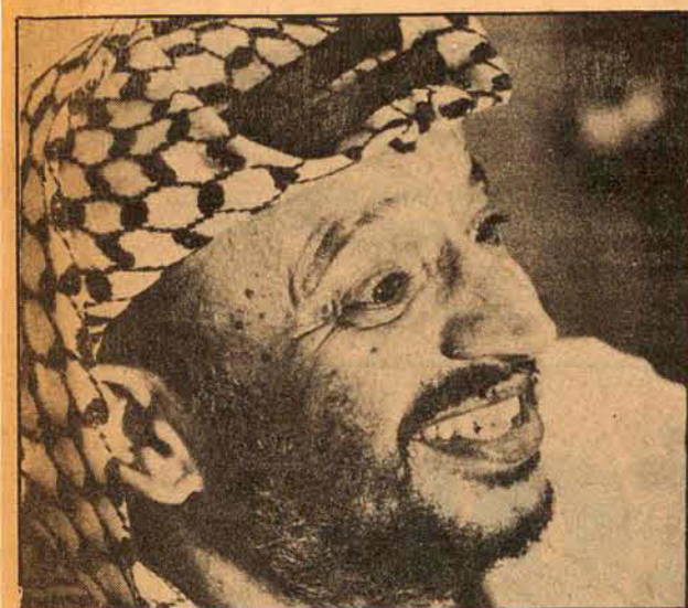
Yasser Arafat: à espera de um convite.