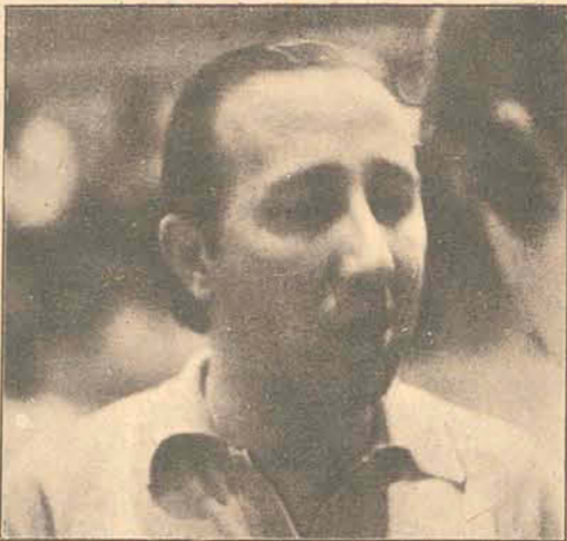
Piazza: surpreso e cético.