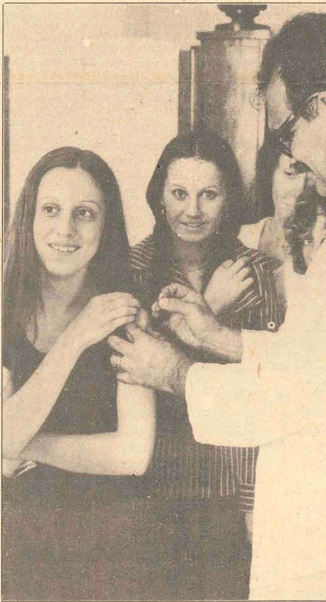
Na Dasp, ou em casa, imunidades contra o sarampo.

O Dasp deu início a Campanha de Vacinação Contra o Sarampo, promovida pela Secretaria da Saúde através do Departamento Autônomo de Saúde Pública de Florianópolis. A Campanha está sendo executada por cinco agentes domiciliares do Centro de Saúde da Capital. No centro da cidade, a vacinação está sendo feita principalmente nos morros. A segunda etapa será no restante da zona urbana e a terceira a zona rural do interior da Ilha.