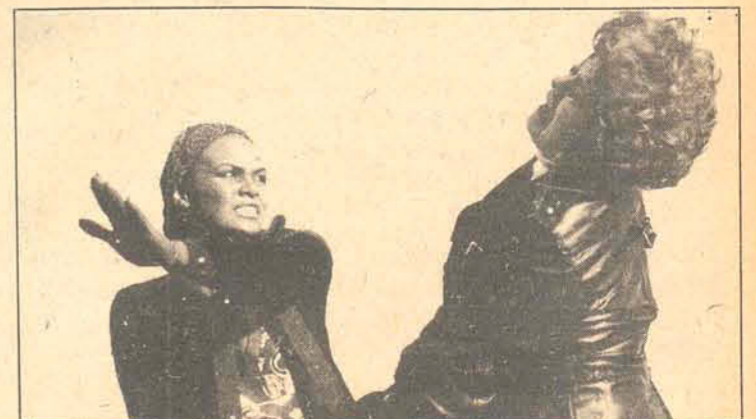
Cleopatra Jones, de Jack Starret.

DUELO EM DIABLO CANYON, de Ralph Nelson, com James Garner e Sidney Poitier. Rajá 8 horas.