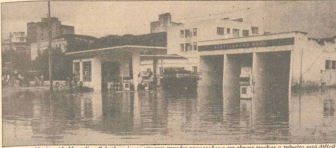
Na Avenida Marcolino Cabral, as águas atingem grandes proporções e em alguns trechos o trânsito está difícil