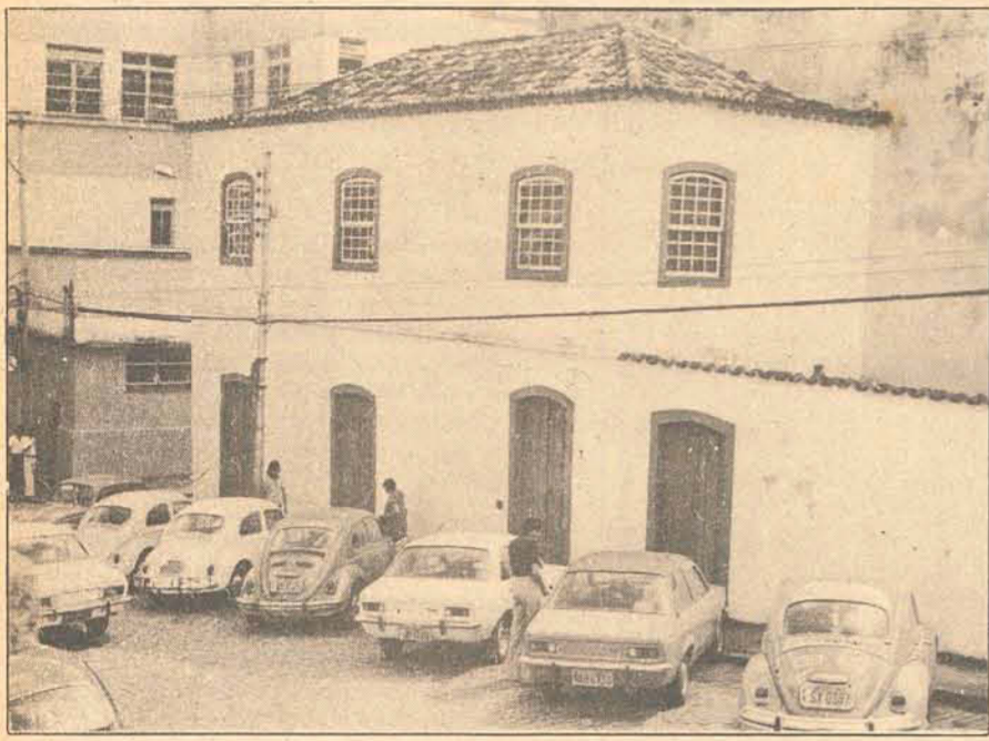
A Casa de Vitor Meirelles está fechada há pelo menos um ano.

O IPHAN está restaurando os quadros de Victor Meirelles e sua casa permanece fechada à curiosidade dos turistas.