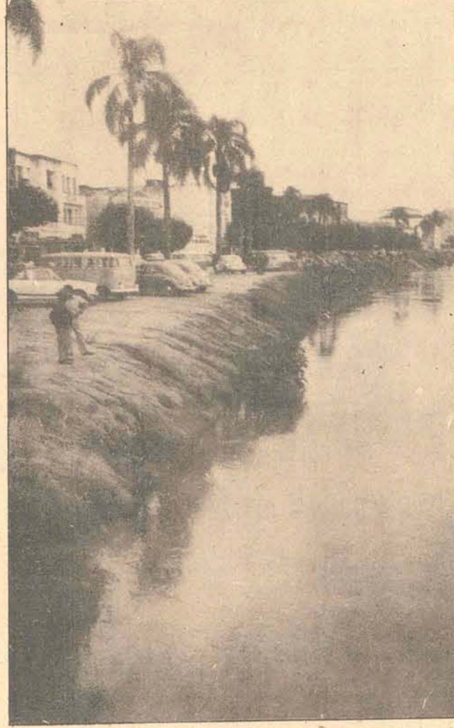
As águas se avolumam e o Rio Tubarão pode transbordar

Tubarão (Sucursal) — O município de Tubarão começou a sentir os primeiros problemas provocados pelas chuvas intermitentes, que atingem toda a Região Sul do Estado desde o último sábado. Inúmeras vias públicas do centro da cidade e vários bairros encontram-se alagados desde ontem, dificultando o tráfego de veículos e causando danos materiais nas residências, casas comerciais e lavouras. Até as últimas horas da noite de ontem as chuvas continuavam caindo em todo o município e as autoridades já se manifestavam preocupadas com a elevação do volume de águas do Rio Tubarão que, gradativamente, vai assumindo proporções assustadoras e podem transbordar alagando toda a zona central da cidade. O Prefeito Irmoto Feuerschuetz determinou imediatas providências de atendimento à população atingida e o Corpo de Bombeiros man-