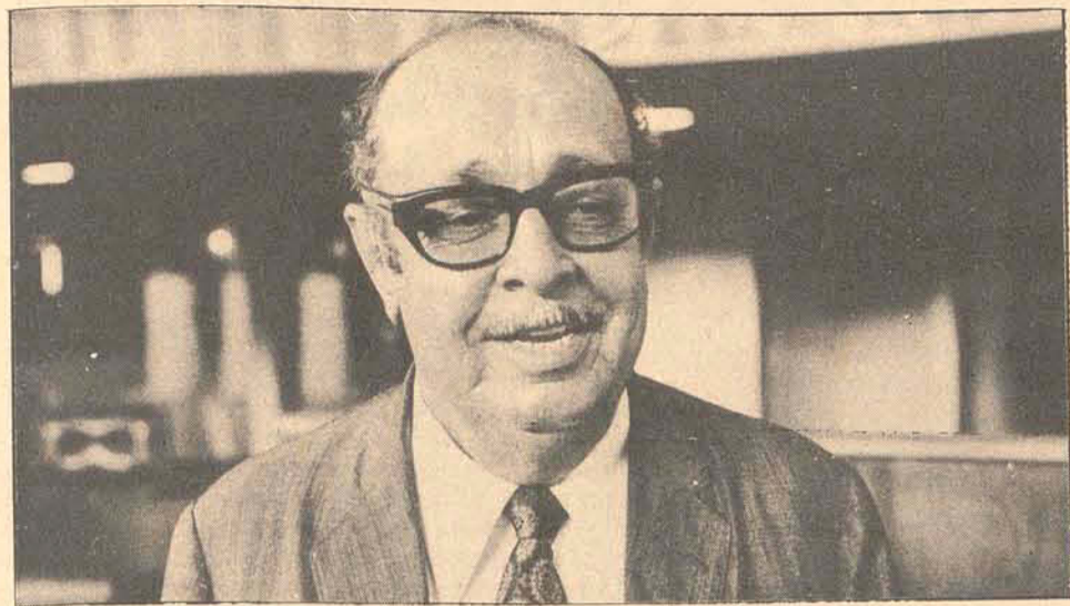
Carlos Buchele deixa em marco a liderança da oposição na Assembléia Legislativa.