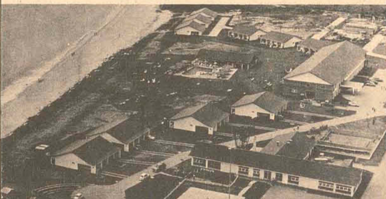
Hotel Plaza Itapema Com 138 apartamentos. Em funcionamento desde dezembro de 1972, na praia de Itapema, SC, a meio caminho entre Porto Alegre e São Paulo. Devido ao seu sucesso está sendo ampliado em 50% na sua capacidade de ocupação.