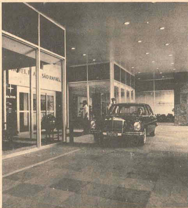
Hotel Plaza São Rafael Com 300 apartamentos. Em funcionamento desde abril de 1973, em Porto Alegre. Com diversos serviços adicionais, sem dúvida nenhuma é o mais bonito hotel do Brasil.