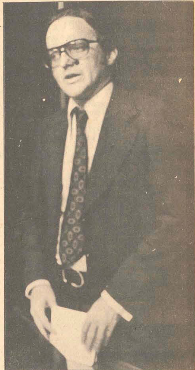
Jorge Bornhausen avistou-se no Rio com o Gal. Golbery.

Independentemente de que possam sugerir os líderes parlamentares, a Executiva tem o propósito de sugerir a criação de uma comissão especial a nível de cúpula partidária para examinar critérios de formação de chapas para o pleito de 15 de novembro, quando serão renovadas as bancadas da Assembléia Legislativa, Câmara Fede-