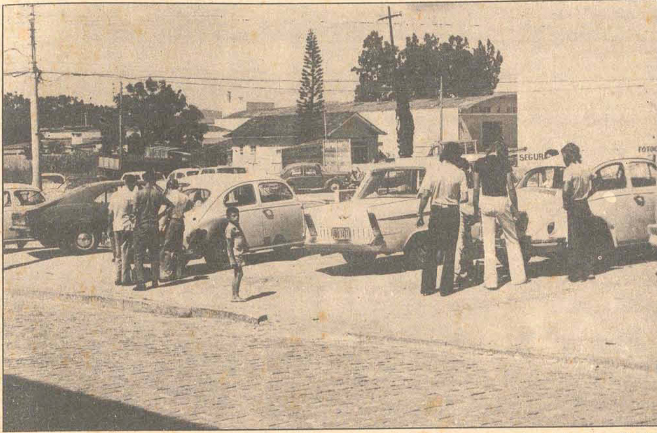
No último dia, os retardatários foram muitos e o serviço ficou tumultuado.