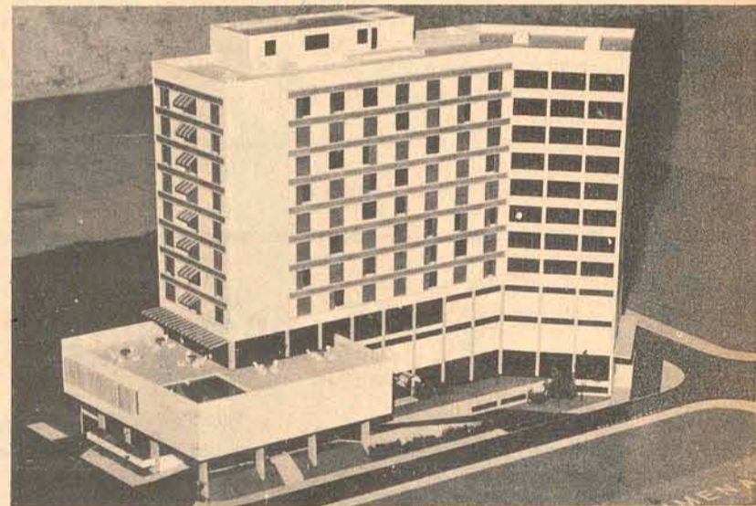
Hotel Plaza Hering Com 136 apartamentos. Em adiantada fase de construção na cidade de Blumenau - SC.