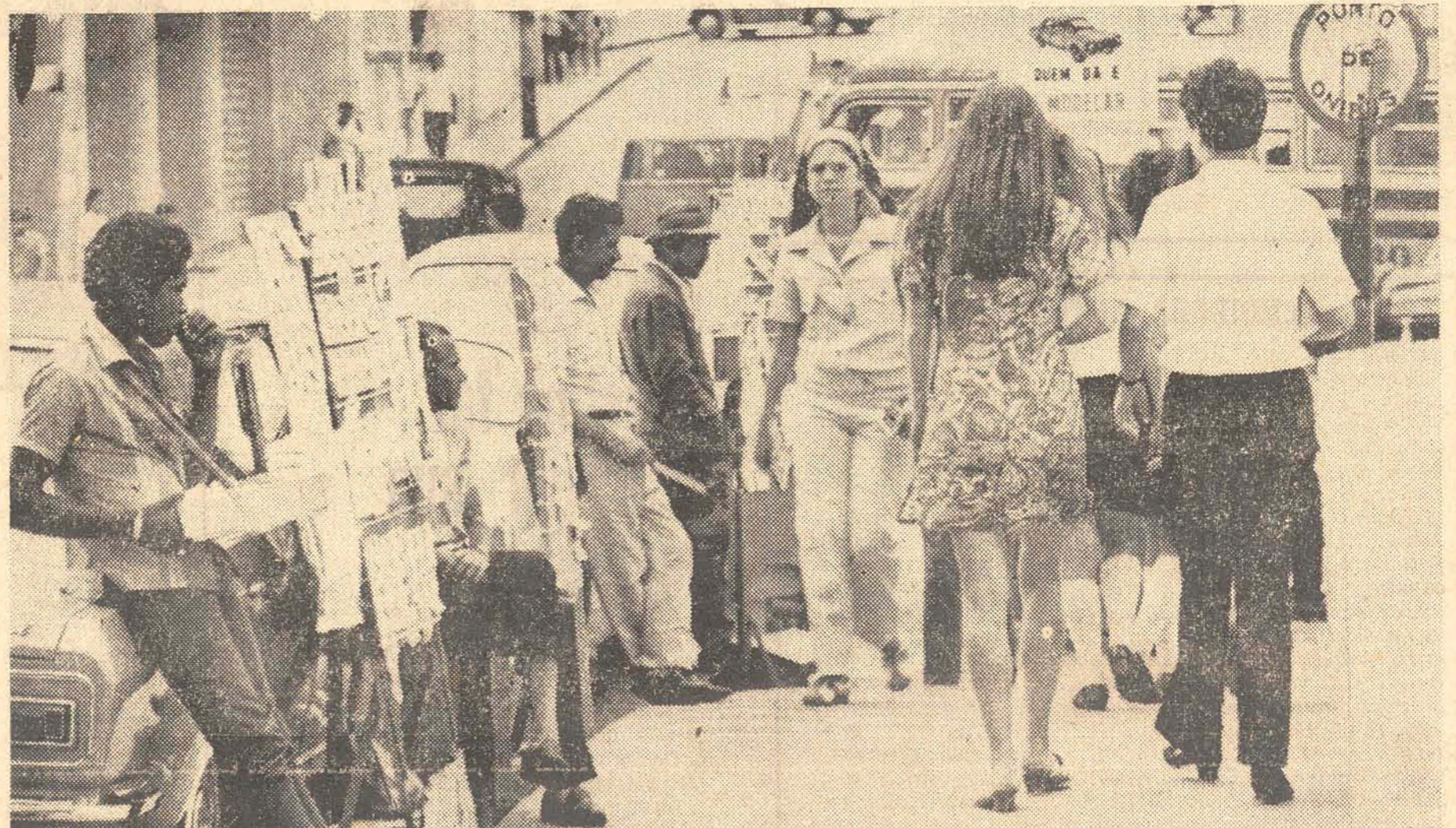
Proliferam nas calçadas os vendedores de Loteria, mas muita gente passa sem dar atenção aos números, à margem da sorte ou do azar