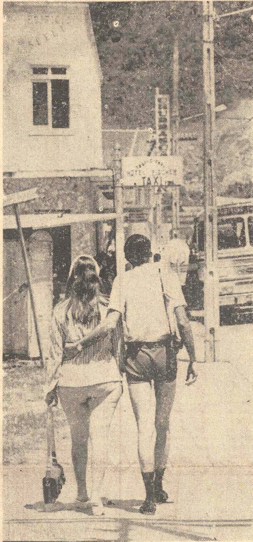
A temporada de praia em Camboriú atrai estrangeiros de todas as paragens. Para alguns, sandália e meia são eficazes meios de transporte.