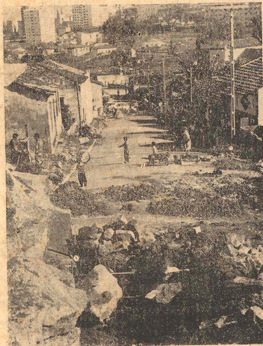
Dentro dos próximos dias estarão concluídas as obras de pavimentação e drenagem da Rua Nestor Passos, que faz parte do programa de urbanização da Cidade executado pela Prefeitura