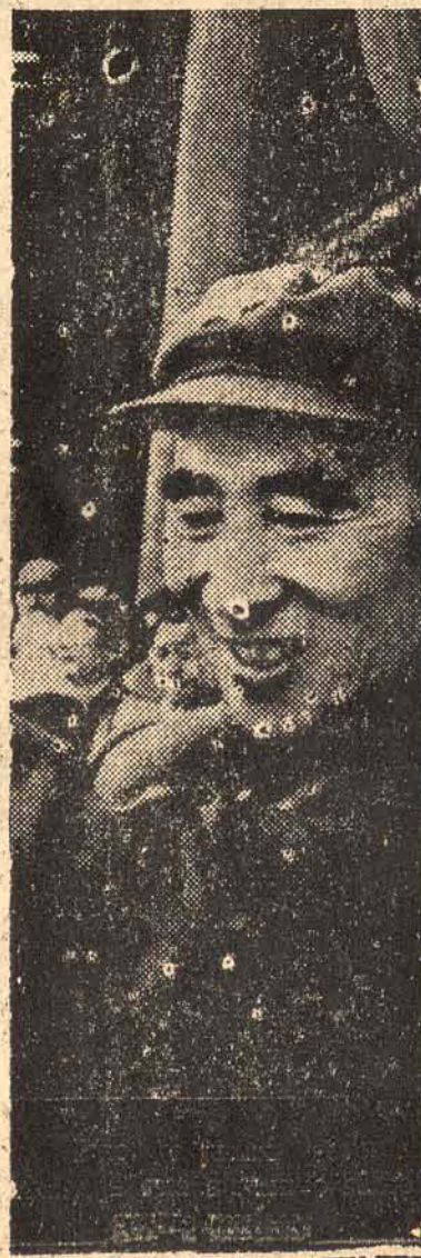
Lin Piao, o futuro governante chinês, já está alertando sobre a guerra nuclear.