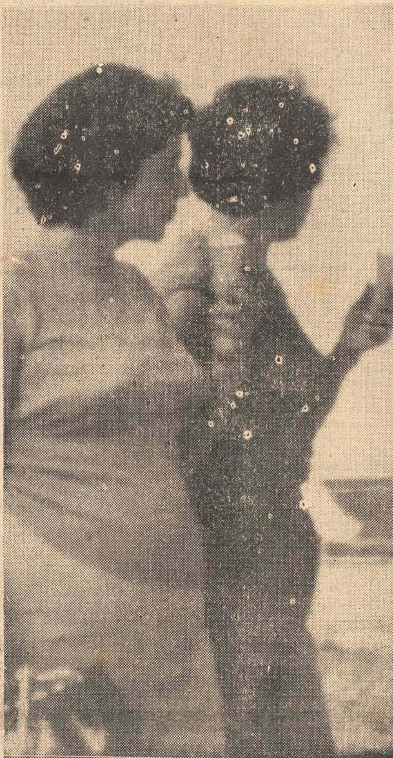
O sorvete é o lenitivo que todos procuram para enfrentar os dias quentes do verão.