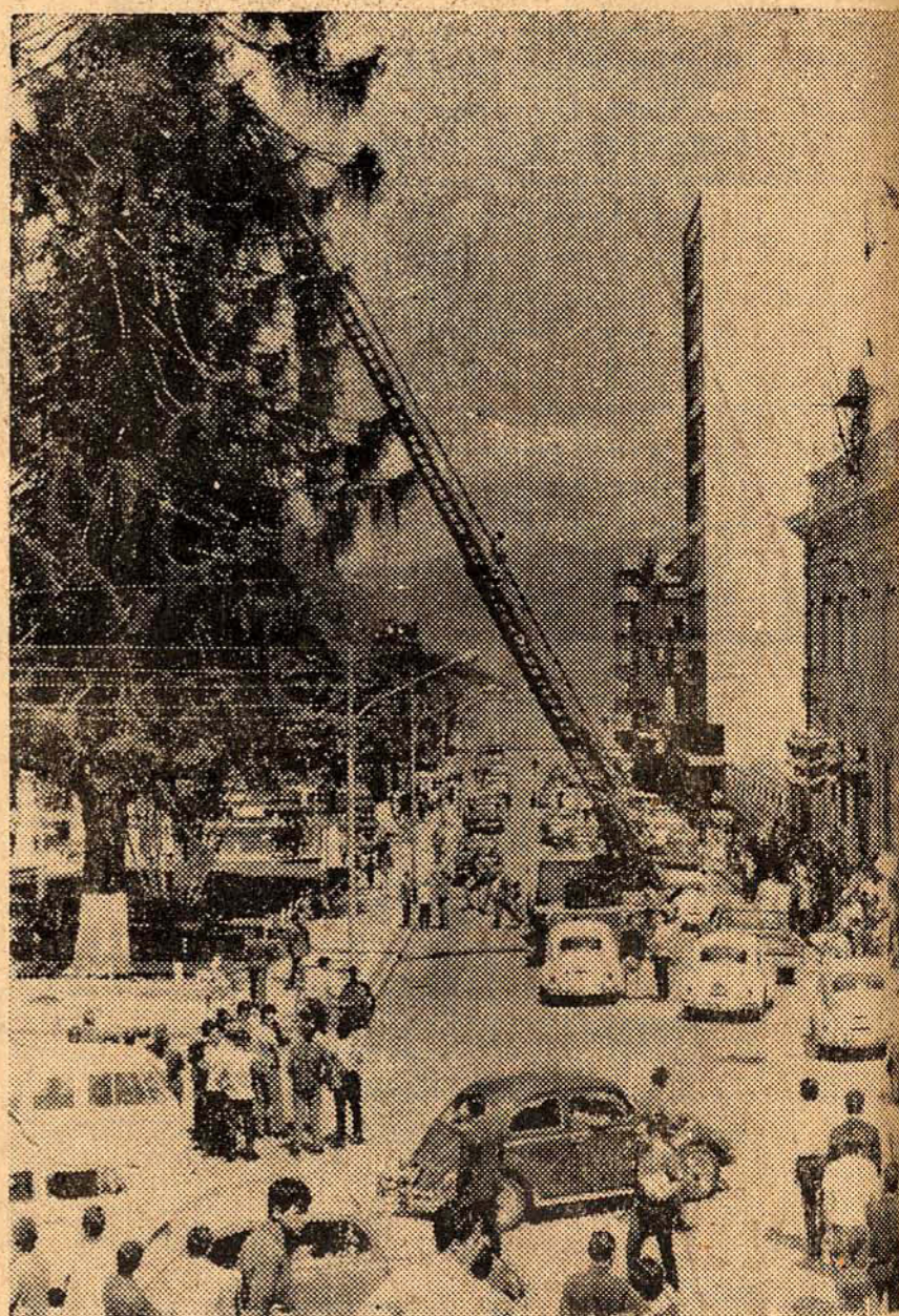
Um periquito que fugiu da gaiola e açou vôo até o cume do pinheiro da Praça XV, desgostando até as lágrimas a sua dona, uma menina que chegou a adoecer por causa da fuga, constituiu-se ontem na principal atração dos populares que acompanhavam o resgate da ave pelo Corpo de Bombeiros, solícito em atender o dramático pedido da sua proprietária.