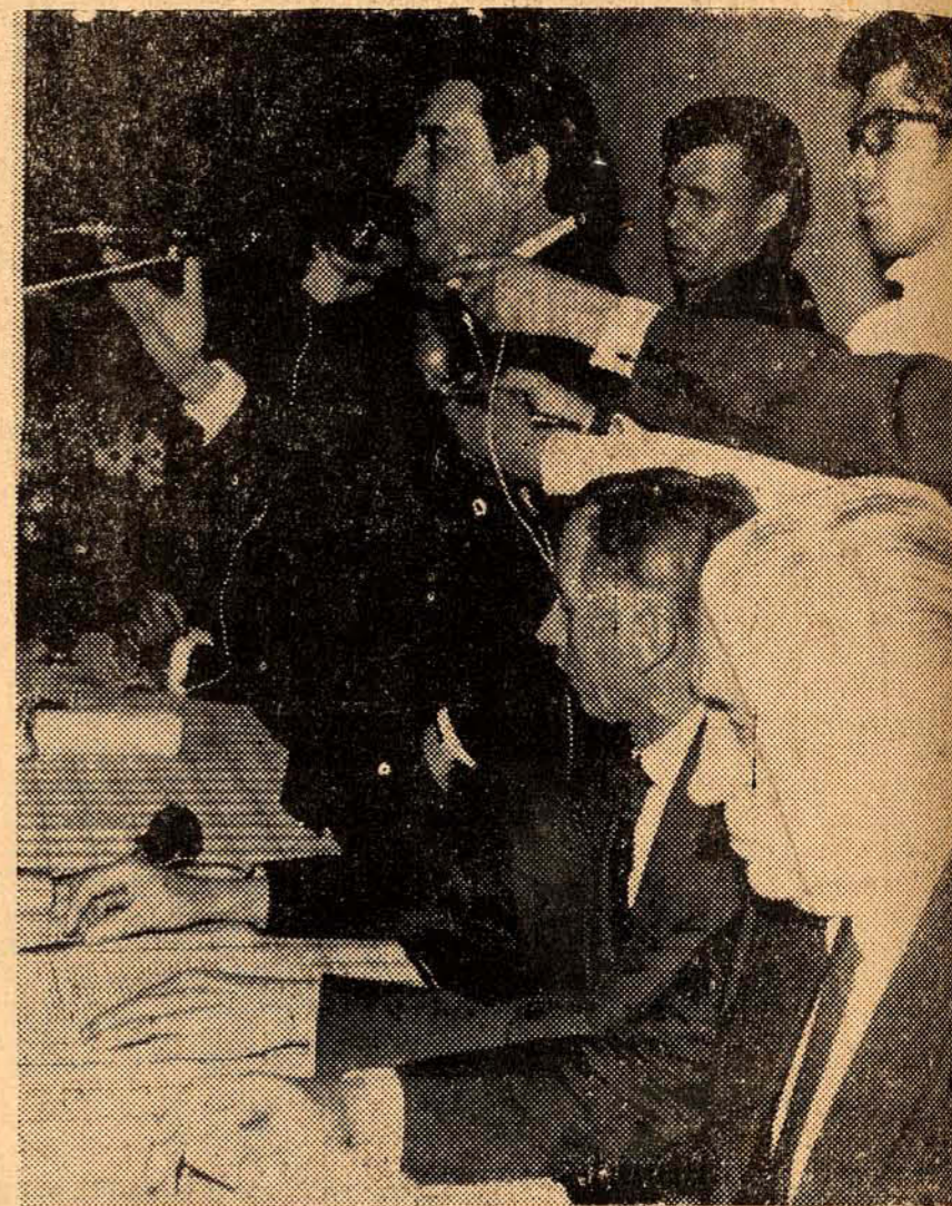
São Bento comemorou festivamente o transcurso de seu 95º aniversário homenageando o Governador Ivo Silveira e o Senador Celso Ramos que receberam em sessão solene da Câmara Municipal os títulos de cidadãos honorários.