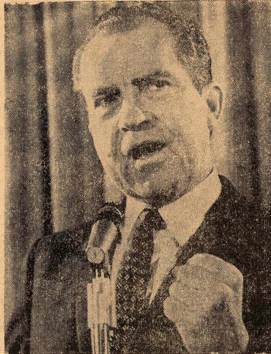
Nixon chebe a indicação do Partido Republicano com o apoio dos convencionais da Califórnia e de Nova York, Estados de Ronald Reagan e Nelson Rockefeller.

O presidente da Convenção, Gerald Ford, chamou Estado por Estado, em ordem alfabética, começando por Alabama. Ao chamado do presidente, cada chefe de delegação anunciou pelo microfone a distribuição dos votos de seus delegados entre os diversos candidatos.