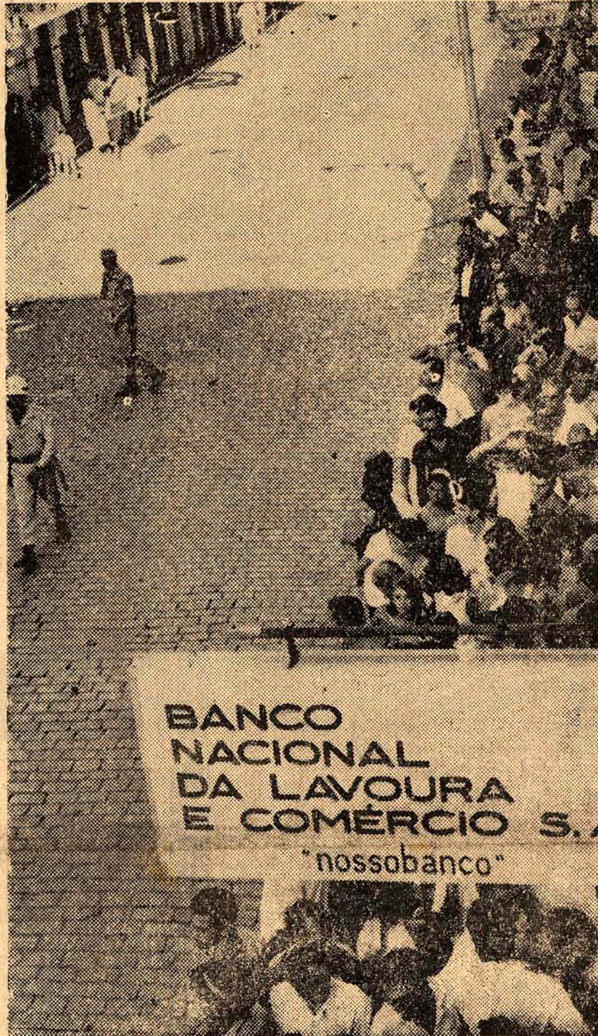
Durante todo o dia de ontem o tráfego de pedestres foi conturbado na calçada fronteira do prédio n.º 34 da Felipe Schmidt, devorado pelas chamas no grande incêndio de anteontem. Movidos pela curiosidade, os populares se aglomeravam diante do local e ficavam a olhar os destroços.

Os novos índices do salário-mínimo do País, bem como sua vigência, serão anunciados oficialmente amanhã, após reunião do Conselho de Política Salarial, a realizar-se no Rio. A decisão foi tomada na manhã de ontem, durante o despacho do presidente Costa e Silva com o ministro do Planejamento, sr. Hélio Beltrão.