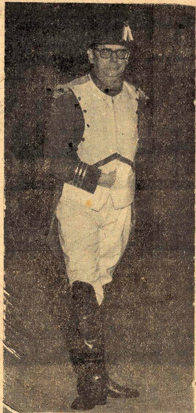
Hoje é o dia.

Trata-se de cinco aparelhos de Raio-X "Medicoor Serix-4", três conjuntos radiológicos "Siemens", dois conjuntos radiológicos "Diagnomax M-125", um eletroencefalógrafo "Elema Schenander", dois aparelhos de Raio-X "Siemens", três aparelhos eletro-cirúrgicos "Siemens Radiotons 617", um conjunto radiológico "Elema Schoenander Triplexa Angromatic" e um aparelho de Raio-X "Siemens-Dermopan-2". Informações do Departamento Central de Compras dão conta de que a operação de financiamento do equipamento importado foi efetuada pelo Banco de Desenvolvimento do Estado e que o material, acondicionado em 147 volumes, será liberado após o desembarço alfandegário.