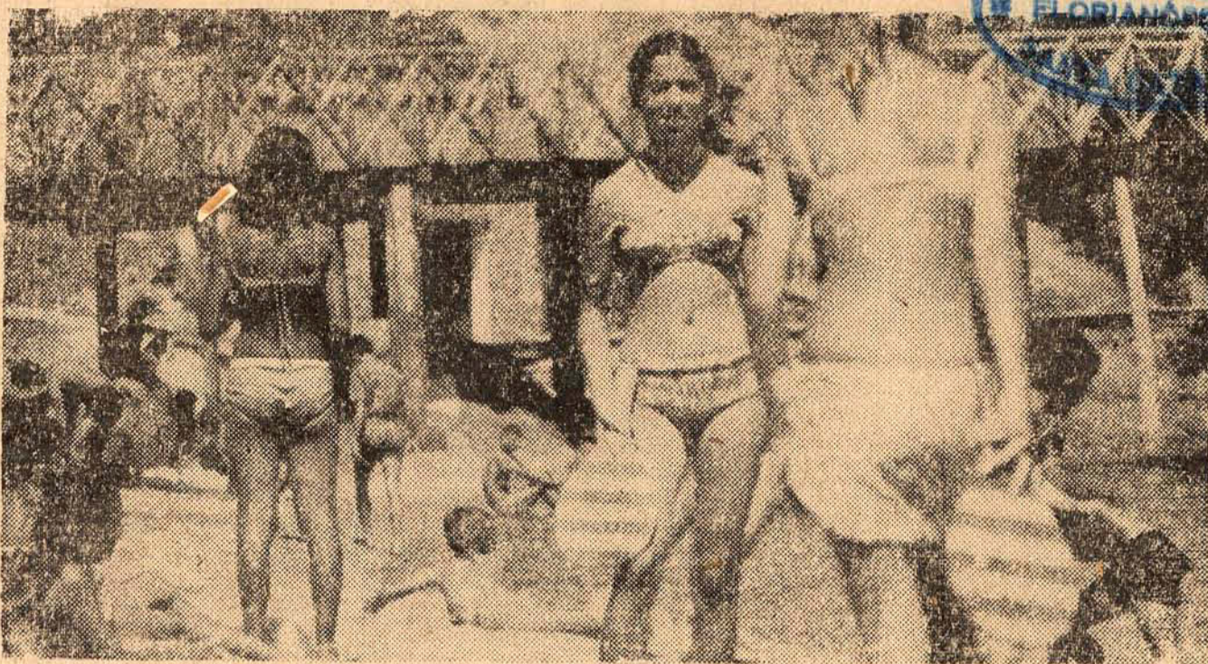
Durante toda a semana os dias foram excelentes para os banhos de mar. Espera-se que neste final o mesmo aconteça, a fim de que todos possam gozar as delícias das praias.