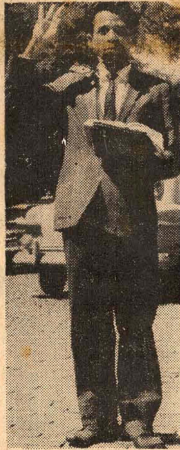
Ontem à tarde ele circulou pela cidade lendo a Bíblia e pregando o Evangelho

Aureo deixa Presidência do Senado e defende Poder Legislativo