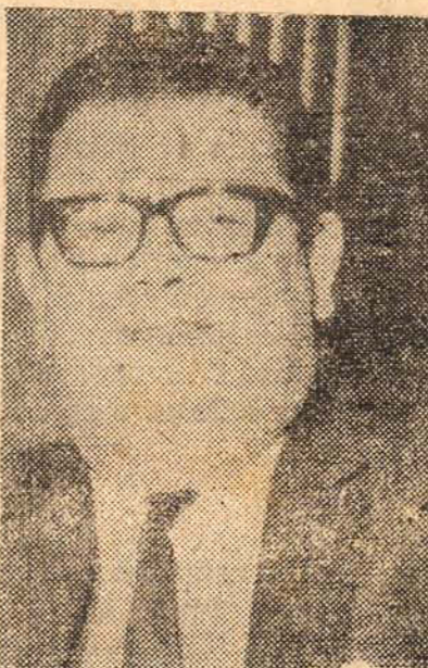
O Ministro Delfim Neto viaja para Washington e estuda com Argentina e Venezuela a aplicação dos investimentos externos.