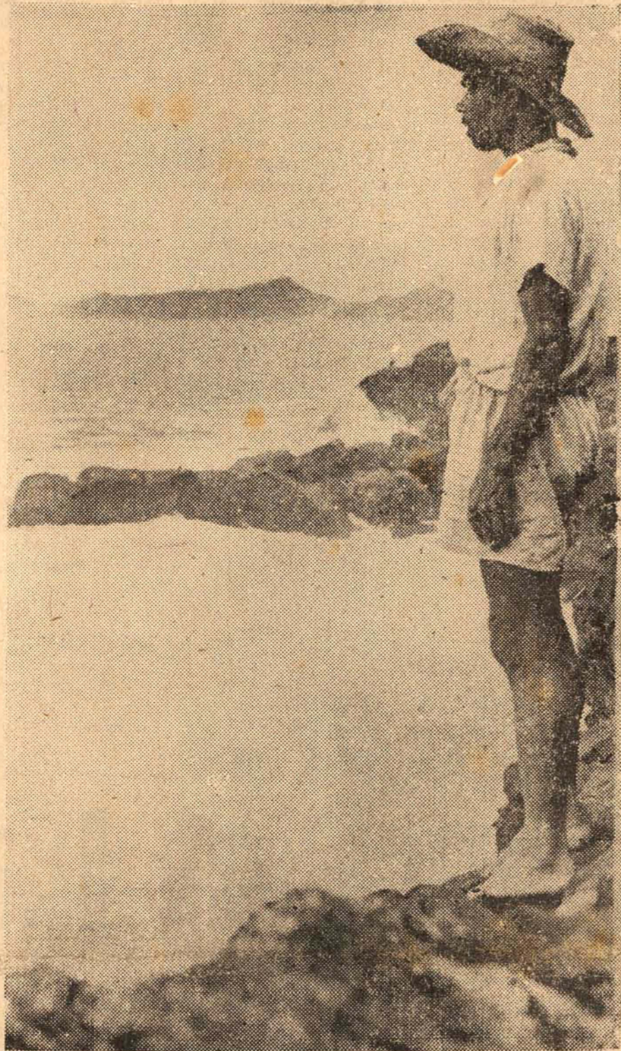
Contemplando o mar, sempre pródigo nas suas dádivas, o pescador lamenta o mau tempo e pensa nas noites calmas em que chegava em casa cansado, mas feliz com o bernal cheio de peixes, e seu pão de cada dia.

Aeroportos, estações de energia, fabricas e outras instalações vitais no norte da Grecia entraram em regime de "black-out" o mesmo se verificando nas cidades da Turquia. No litoral turco, milhares de soldados já se encontram a bordo de embarcações para a qualquer momento, iniciarem a invasão da ilha de Chipre.