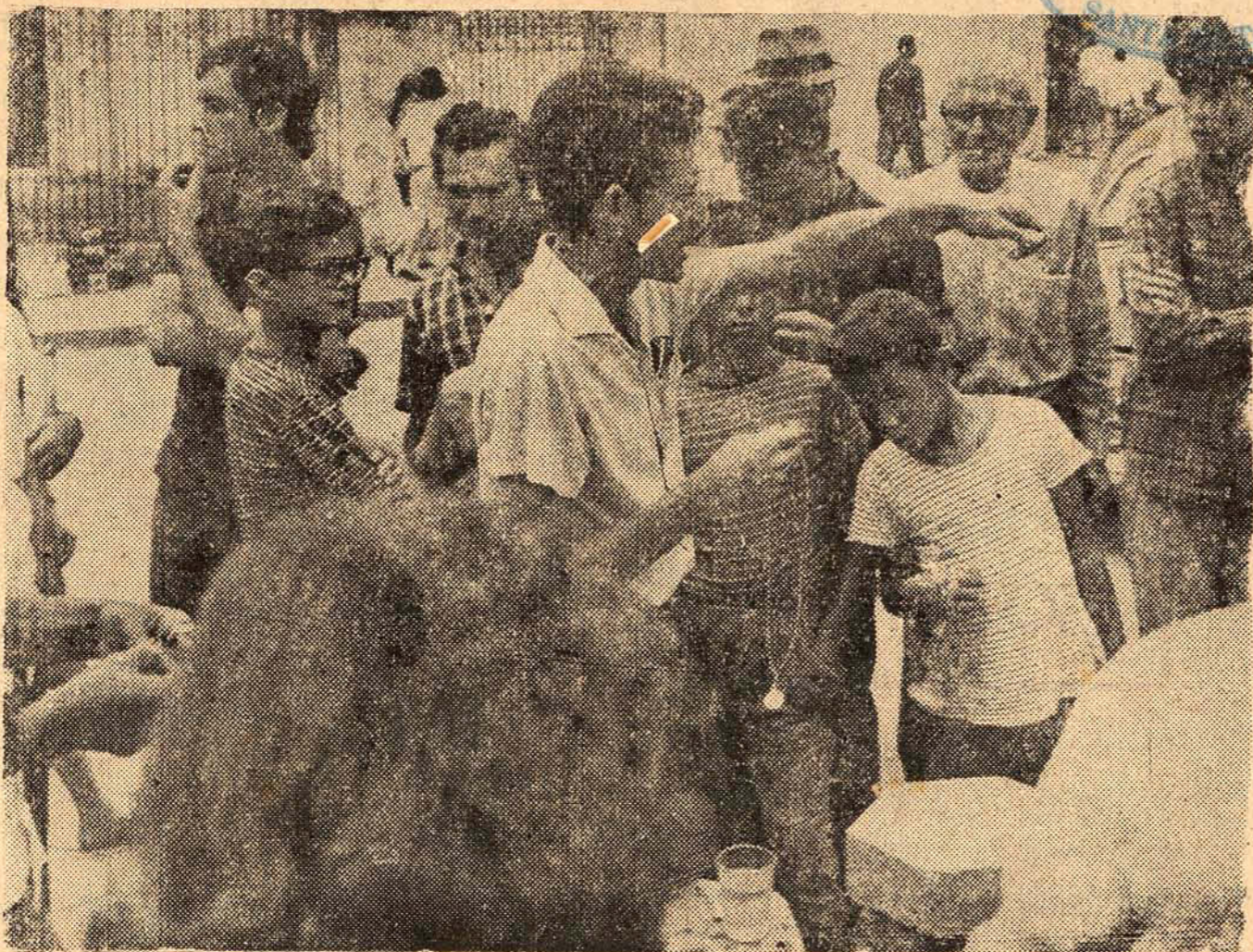
ML e um artifícios para atrair o público fazem parte da técnica dos camelôs para vender seus "produtos importados", que geralmente são fabricados em Biquiçu e Tijucas