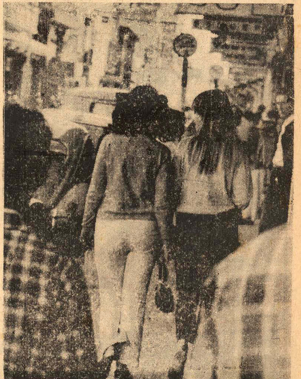
As turistas que remanesceram, percorreram ontem a Felipe Schmidt no azáfama das últimas compras, proporcionando aos transcuntes um desfile de adus.