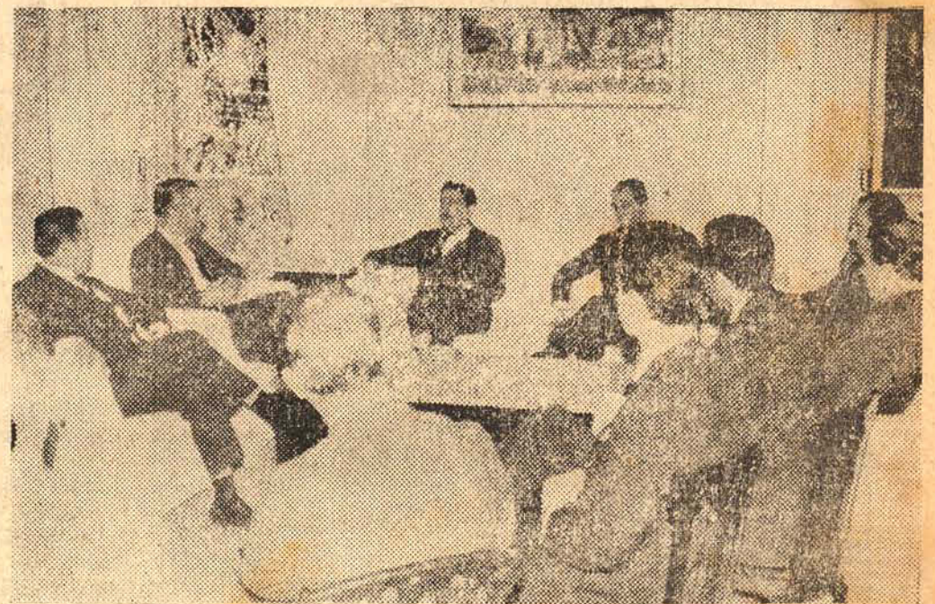
O governador Ivo Silveira recebeu em audiência especial os dirigentes da Associação Comercial e Industrial de Joinville, que se fizeram acompanhar dos parlamentares que representam aquele município na Assembléia Legislativa