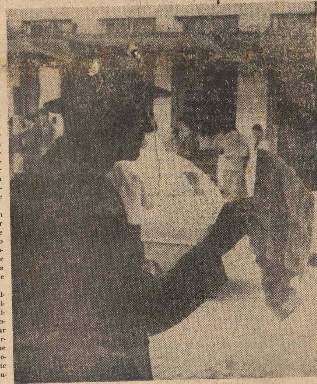
O vendedor de bilhetes lotéricos vende hoje a sorte grande de amanhã. O transigente que passa os vezes não resiste e compra o seu bilhete, fazendo fé, achando que "desta vez o azar vai acabar".