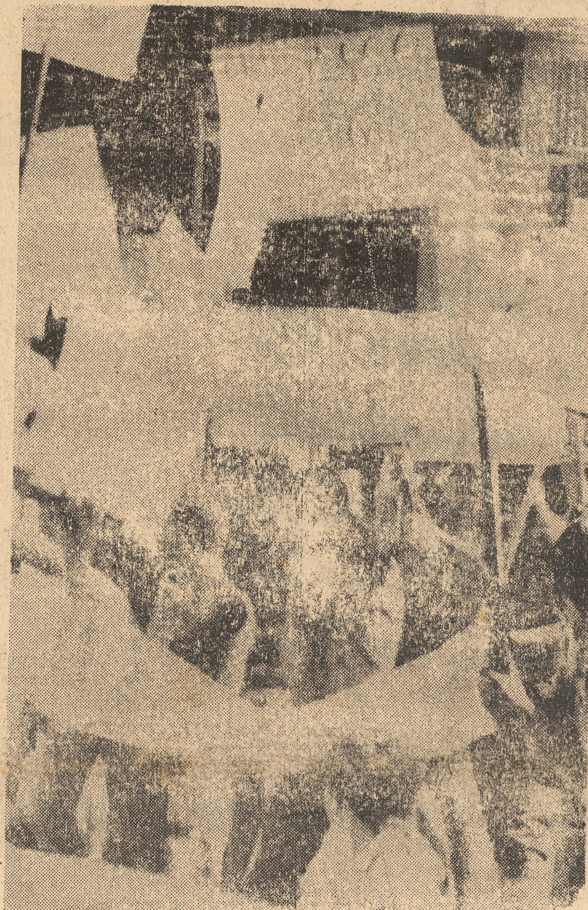
Calouros da Faculdade de Medicina tiveram ontem o irremediável trote para o qual não encontram nem encontrarão remédio