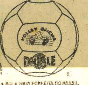
A BOLA MAIS PERFEITA DO BRASIL

homens de negócios a tomar a iniciativa da conquista do mercado. Mas estes têm se mostrado indiferentes ou demasiadamente cautelosos, em face das notícias de inflação desordenada e instabilidade política em muitas nações latino-americanas, especialmente no Brasil. Segundo os observadores, uma ação efetiva do Brasil poderia resultar em bons investimentos ingleses em nosso país. De qualquer forma, algumas firmas britânicas preparam-se para operar no Brasil e daqui partir para a penetração da América Latina, através da ALALC.