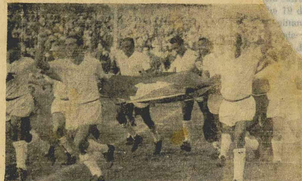
VOLTA OLIMPICA — Logo após o prêmio de domingo os craques do Metropol, saudados pelo publico presente ao Estádio dr. Adolfo Konder deram a Volta Olímpica.

A sociedade de navegação "Costa" proprietária do navio, confirmou que Mazola reservara duas passagens de primeira classe, em seu nome e no de seu tio, e que essas passagens já haviam sido adquiridas em forma definitiva.