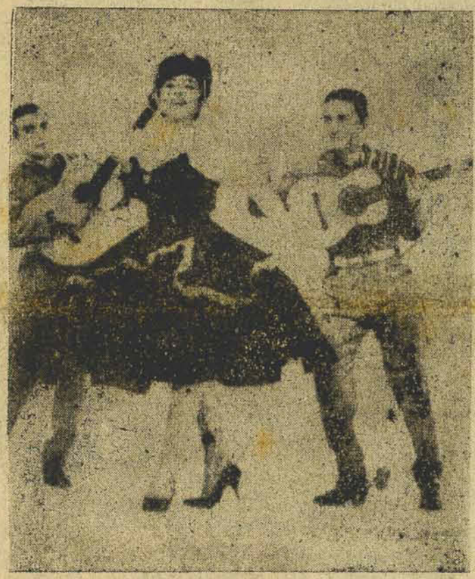
Los três do Chile