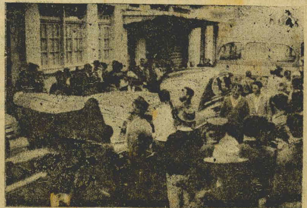
Flagrante tomado na esquina da "Conseineiro Barra" com seu de... onde registrou-se violento choque de veículos, envolvendo nada menos que um caminhão, dois automóveis e um ônibus. Do choque não resultaram vítimas, sendo de vulto os prejuízos materiais. Ontem repetiu-se o acidente no mesmo local. (LEI NA 8.ª PAGINA).

foram mortos, 18 desapareceram e 43 armas foram apreendidas pelos rebeldes, numa emboscada preparada pelos Vietcongs, na região de Kanuel, no Vietnam do Sul. Os rebeldes, ao que se informa, sofreram poucas baixas.