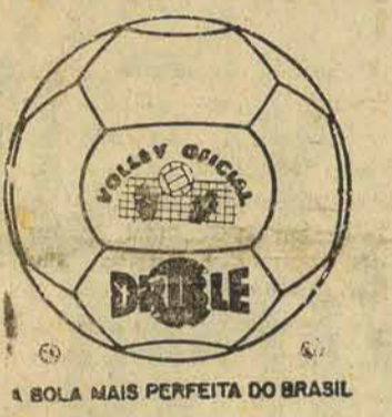
A BOLA MAIS PERFEITA DO BRASIL

VENDE-SE 6-6J Um BAR bem frequentado sito a rua Santos Saraiva anexo ao Hotel São Cristóvão, bem assim uma propriedade de construção mista. Interessados podem tratar com o proprietário no endereço a qualquer hora. Endereço: 26-5-1964.