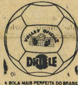
A SOLA MAIS PERFEITA DO BRASIL

BUENOS AIRES, 8 (OE) — O Frei José de Guadalupe, outrora famoso Frei José Mojica, que se encontrava em nosso país, chegou hoje a Buenos Aires. Frei José de Guadalupe, pretende apresentar-se num canal de televisão na Argentina, em benefício das Obras Caritativas de São Francisco de Assis.